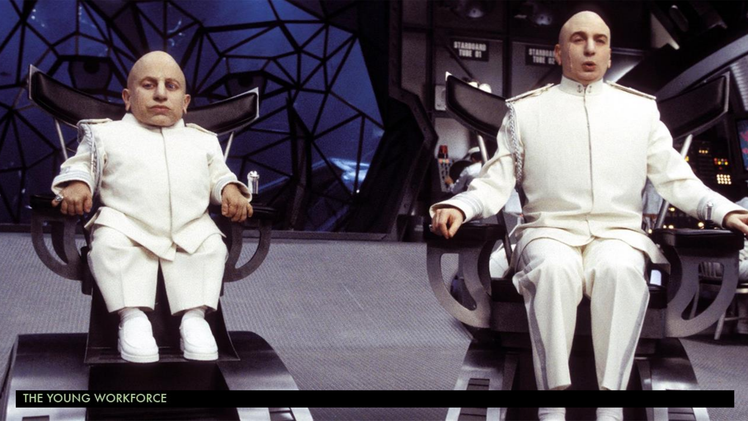
THE YOUNG WORKFORCE