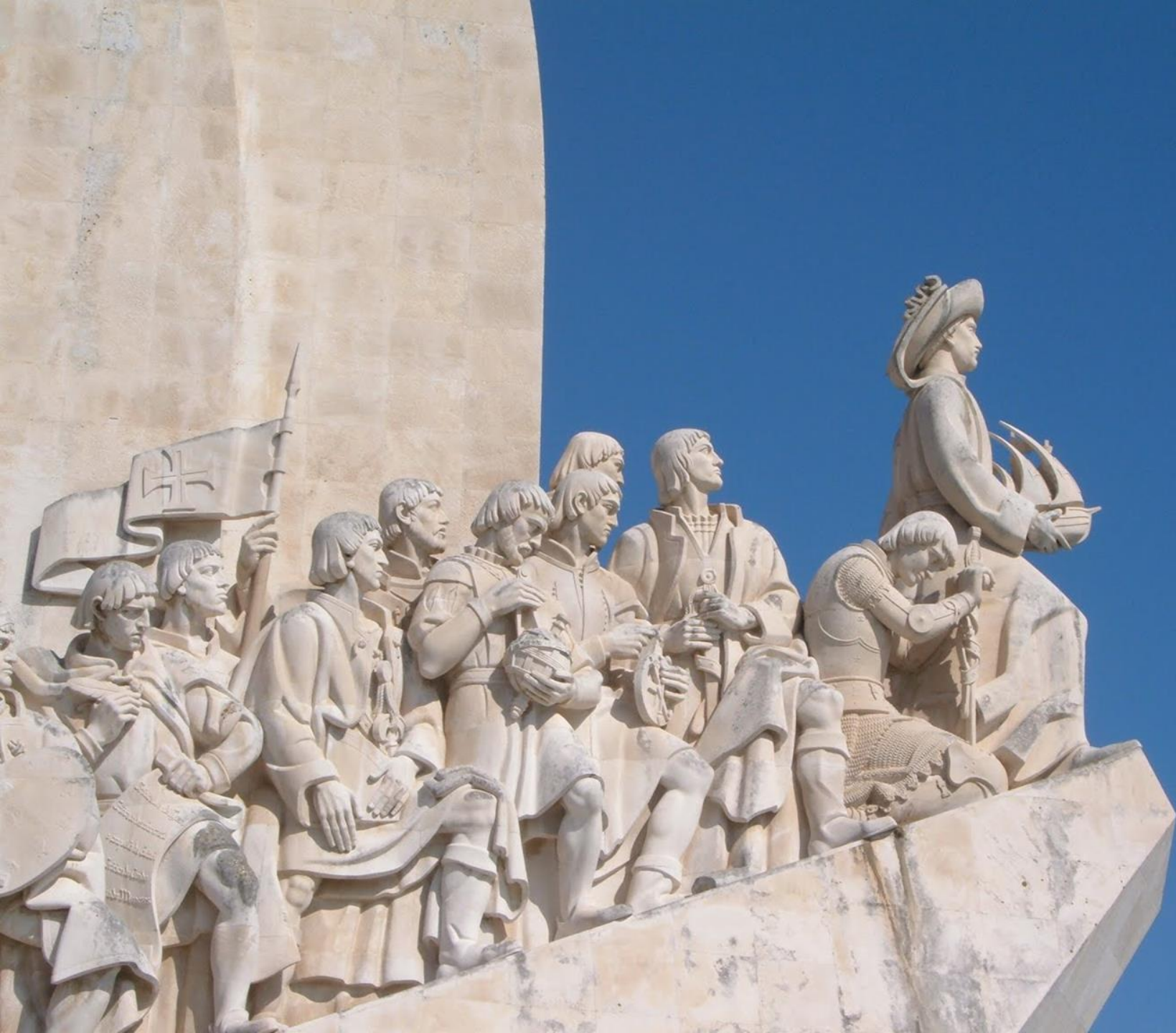
Monument der ontdekkings, Lissabon